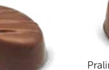
Gianduja céréales croustillantes chocolat lait