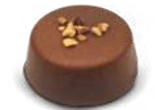
Praliné noisettes brutes chocolat lait