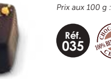
Ganache Citron Chocolat noir