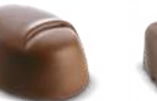
Praliné Amandes blanchies Chocolat au Lait