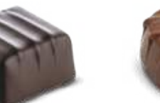
Ganache Noir intense Chocolat noir