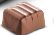
Praliné Caramel Chocolat au lait