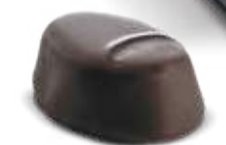
Praliné Amandes brutes Chocolat noir