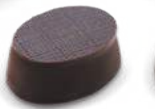
Ganache Thé Chocolat Noir