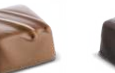
Ganache au Caramel Chocolat au lait