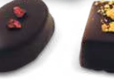
Ganache Framboise Chocolat Noir